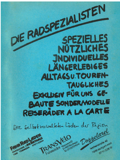
Bild 3: Gemeinsame Werbeanzeige mit anderen selbstverwalteten Radläden aus der Region, 1990

steigerung des Ladens errechnet und entsprechend mehr ausgezahlt – oder auch mal deutlich weniger, wenn es schlecht gelaufen war.