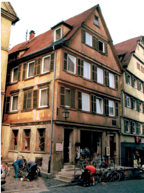
Bild 1: Der »Fahr-Rad Laden Gegenwind« öffnete 1983 in einem renovierungsbedürftigen Haus mitten in der Tübinger Altstadt

Anfangs haben wir uns bemüht, alles im Konsens zu entscheiden. Keiner wollte gern »auf Chef machen«. Irgendwann haben wir das alles dann in einem Vertrag geregelt. Jeder hatte seine Schwerpunkte: Einer hat mehr